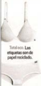
Total eco. Las etiquetas son de papel reciclado.

LA MODA, LA GASTRONOMÍA Y EL DISEÑO NO ESTÁN SEPARADOS CON LA CONCIENCIA ECOLÓGICA. ES LO QUE DEMUESTRA ESTA SECCIÓN CADA SEMANA